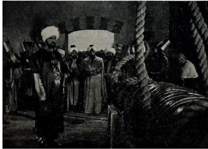
İstanbul'un Fethi 'nden