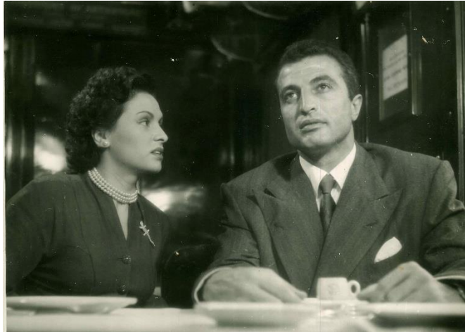
Ankara Ekspresi afişi ve setten bir lobi