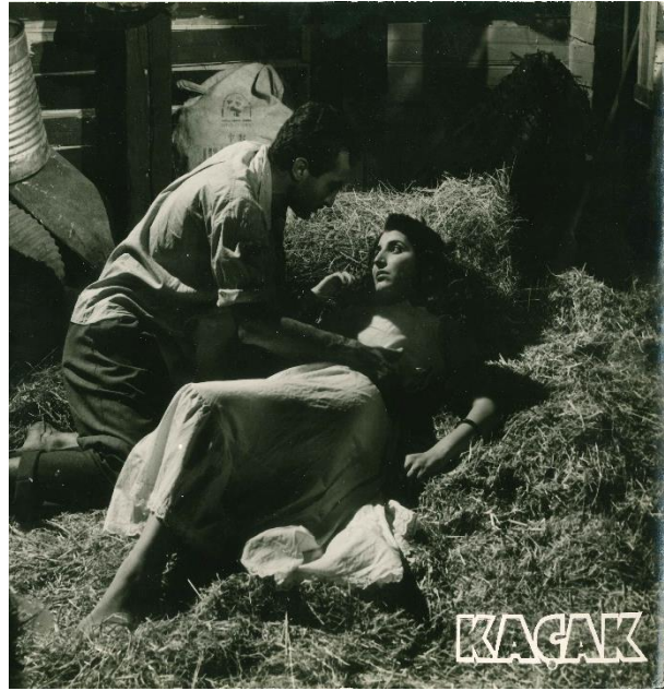
Kaçak filminden kareler