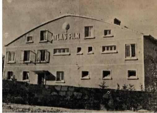
Atlas Film Stüdyosu binası

Atlas Film Stüdyosu, 1947'de iki ortak, Nazif Duru ve Murat Köseoğlu tarafından Mecidiyeköy'de üç buçuk dönüm bir arazi üzerine inşa edilmiş görkemli bir binaydı. Cumhuriyetin ilk fabrikalarından biri olan Likör Fabrikasını geçince "Atlas Film Stüdyosuna Gider" tabelasının yanından dönülüyordu stüdyonun yoluna. Atlas Film büyük oynuyordu; gösterişli, pahalı üstünyapımlarla yollarına devam etmekte niyetleri. Üç kattan oluşan geniş, betonarme bina beyaz sövelerle çevrili pencereleriyle ve yine bu söve malzemesiyle çatı katının duvarına işlenmiş "ATLAS FİLM" yazısıyla oldukça dikkat çekiciydi.